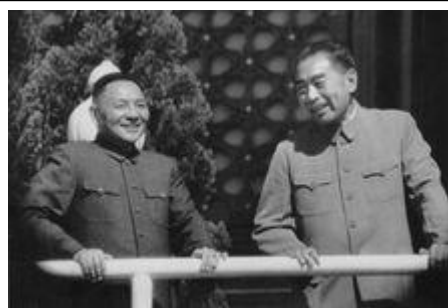
1963年10月，周恩来和邓小平在天安门城楼上

他参与制定和亲自执行重大的外交决策。1950年朝鲜战争爆发，他协助毛泽东指挥中国人民志愿军作战，并