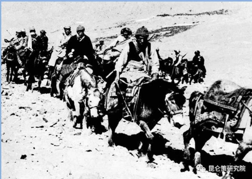
图为逃亡西藏的达赖（骑白马者）

当日夜晚10时左右，西藏上层叛乱集团即按其预谋，将达赖喇嘛及其家属劫出拉萨，在美国中央情报局的协助下，奔向了流亡印度之途，沿途要地都有叛乱武装警戒接应。美国中央情报局设在达卡的基地与达赖喇嘛保持密切联系，并准备好一种适合在西藏稀薄空气中飞行的C-130型运输机，随时给他们空投所需物资。