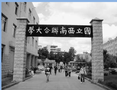
原西南联合大学校门

肝胆洞，是人杰，后人继，中兴业。人 心齐强寇灰飞烟灭。面对桐阴满庭芳，乱云 暗渡永无歇。步先贤、慷慨振神州，立意 决。