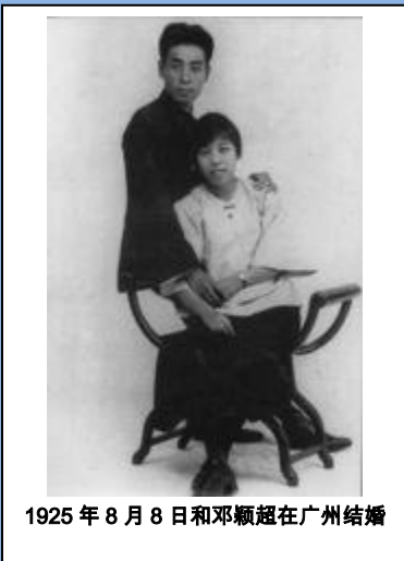
1925年8月8日和邓颖超在广州结婚

1924年秋回国，在国共合作期间任广东黄埔军校政治部主任，国民革命军第一军政治部主任、第一军副党代表等职，并先后任中共广东区委员会委员长、常务委员兼军事部长，两次参加讨伐军阀 陈炯明 的东征，创建了行之有效的军队政治工作制度。