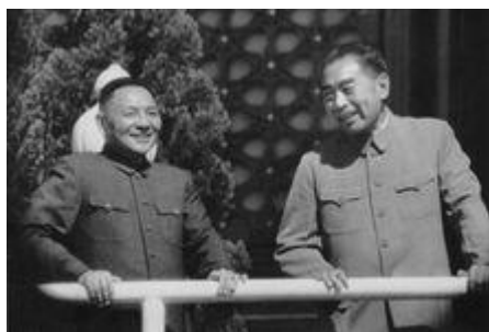
1963年10月，周恩来和邓小平在天安门城楼上

他参与制定和亲自执行重大的外交决策。1950年朝鲜战争爆发，他协助毛泽东指挥中国人民志愿军作战，并