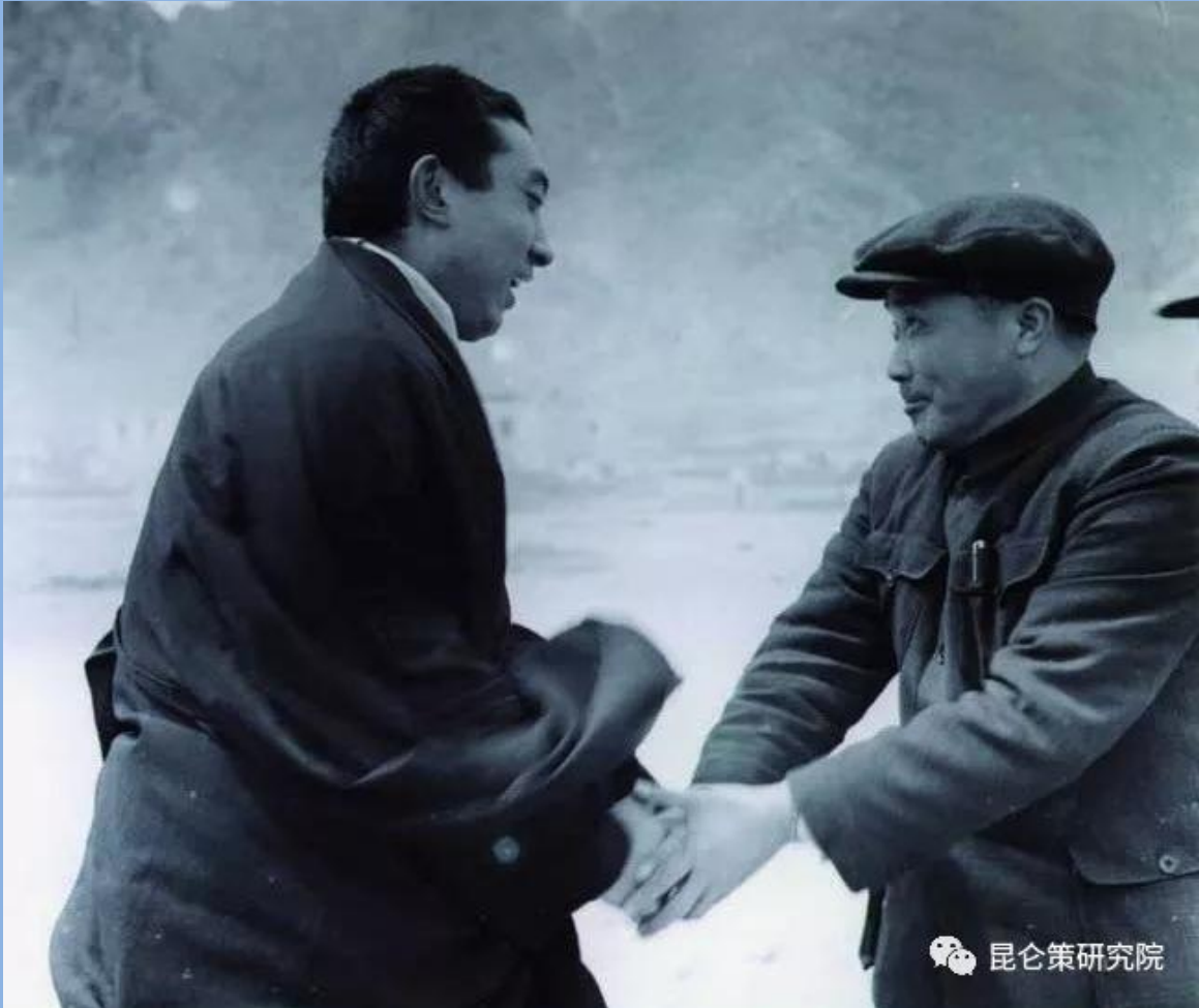
图为 1959 年 4 月 5 日，西藏军区司令员张国华迎接十世班禅额尔德尼到拉萨

在三年的平叛斗争中，人民解放军共歼灭叛匪 93000 余人，缴获各种枪支 35500 余支，各种炮 70 门，电台 41 部，击毙和俘获空降特务 25 名。