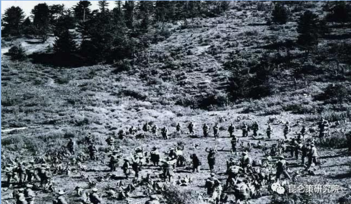
图为4月8日，人民解放军向盘踞山南地区的叛乱武装实施多路反击，迅速平息了山南地区的叛乱