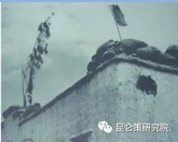
图为盘踞在罗布林卡北侧的叛乱武装向解放军运输站、油库、碉堡开炮