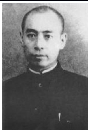
西安事变时的周恩来

1961~1965年为纠正“大跃进”带来的失误，扭转经济困难局面，他和刘少奇、邓小平领导了国民经济的调整工作，使国民经济逐步得到恢复和发展。他强调建成社会主义强国，关键在于实现科学技术现