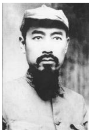
红军时期的周恩来

1931年12月，离开上海到中央革命根据地，先后任中央苏区中央局书记、中国工农红军总政治委员兼第一方面军总政治委员、中央革命军事委员会副主席。