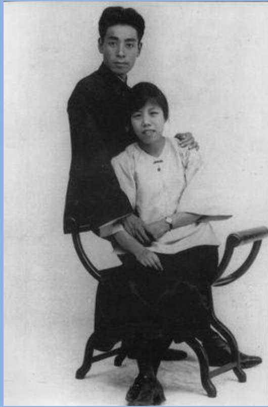
1925年8月8日和邓颖超在广州结婚

1928年在中共六届一中全会上当选为中央政治局常务委员。后任中央组织部长、中央军委书记。为保证中共中央在上海秘密工作的安全，为联系和指导各地区共产党领导的武装斗争，为发展在国民党统治区的秘密工作，起到了重要作用。在这一阶段的大部分时间内，他实际上是中共中央的主要主持者。